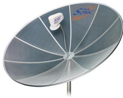
Figura 2. Antena parabólica.